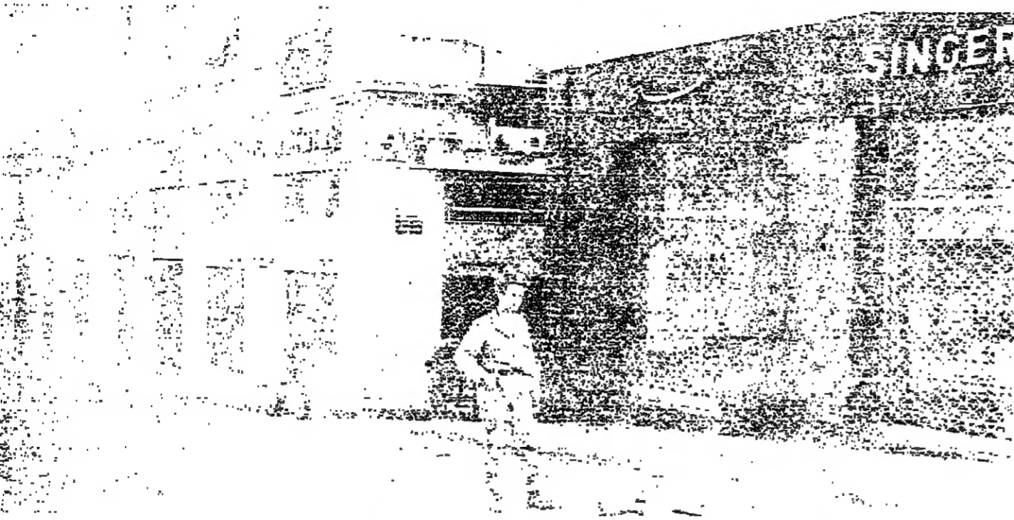
■ ممنوع المرور .. رجال الأمن يحرسون أحد الأسواق التجارية

شهدت العاصمة امس تصنعا نسبيا في حالة الامن. دفع المواطنين إلى التناول بابكانية نجاح مباحسي التهيئة . الا ان هذا التناول كان حذرا إلى حد بعيد ، ذلك ان الذين اضطروا لمغادرة بيوتهم لتضاء بعض الاعمال ، كانوا يتنقلون في الشوارع بحذر شديد نخوفا من نشاط القنصاة الذي كان لا يزال مستمرا طول يوم امس . وعدد كبير من المواطنين اضطرتهم الحاجة إلى بعض المواد الغذائية والاستهلاكية للنزول إلى الأسواق على امل تامين حاجته ؛ الا ان الأسواق كانت مغلقة جميعها ، وكانت هناك نقط بعض العربات التي تتجول بكبيسات من الخضار والفاكهة . وقد لفت النظر امس ، قيام عمال التنظيفات بحملة ناشطة لجمع النفايات من الشوارع .